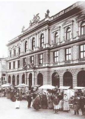
Eröffnung des Sparkassen-Gebäudes an der Promenade Ende des 19. Jahrhunderts